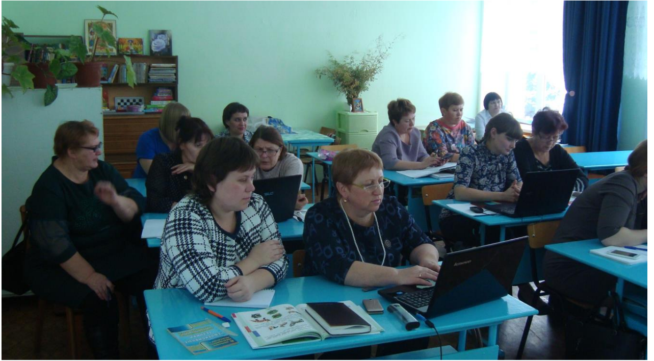
3. Защита проектов слушателями как логичное завершение программы стажировки.