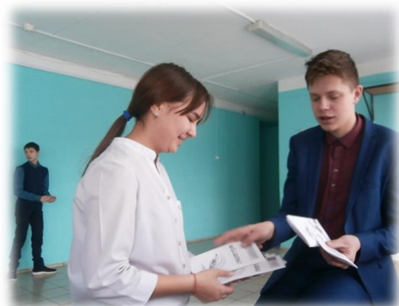
Акция «Звонок другу» (Призыв сделать звонок хорошему, но забытому другу, человеку, с которым давно не общался).