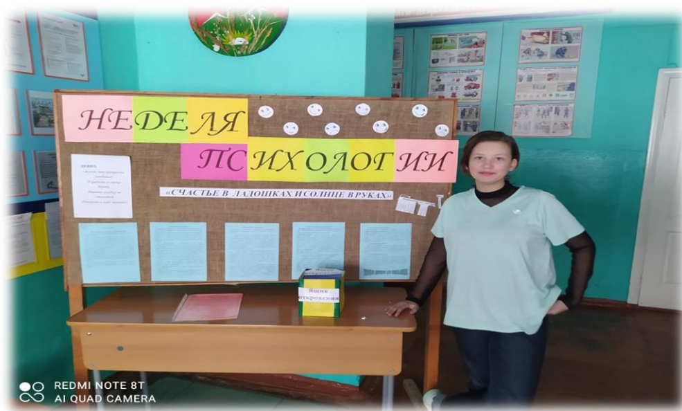
Акция «Дружные ладошки Добрых Дел»

В течение недели проходили разные мероприятия с вовлечением волонтеров и всех участников образовательного процесса, которые стимулировали интерес к психологическим знаниям и к деятельности школьного психолога. Способствовали повышению позитивного настроения, умелому использованию психологических знаний для улучшения качества жизни взрослых и детей. Способствовали созданию в стенах школы атмосферы доброжелательности, толерантности (взаимопринятия, терпимости), эмпатии (сопереживания).