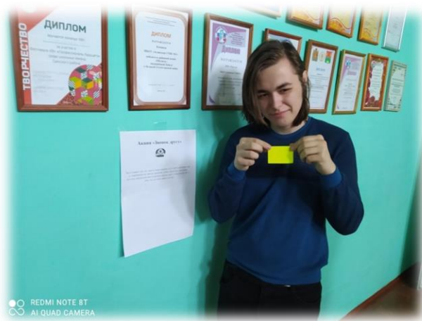
Классный час «Жизненные ценности нашего класса» для обучающихся 5-11 классов