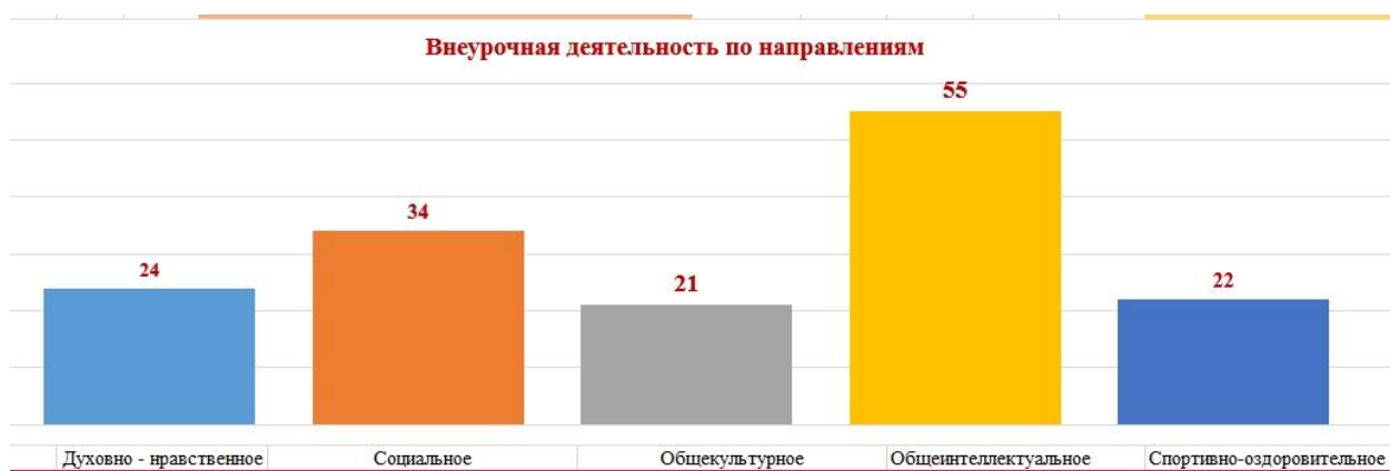
Пример сводной ведомости результатов обучающихся 8б класса за 2019 – 2020 учебный год на основе данных электронного портфолио